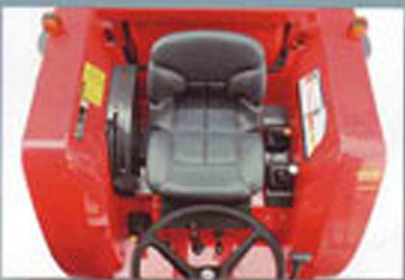
เบาะนั่ง

ที่ฝึกเท้า • ควบคุมทิศทางได้แม่นยำและปลอดภัยในการใช้งาน