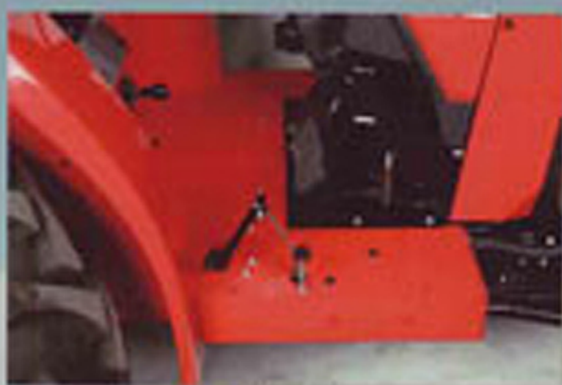
ที่ฝึกเท้า